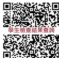
學生檢查結果查詢